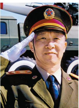
ياك يەگۇڭنىڭ سۇرەتى (ماتەرىيال سۇرەت).