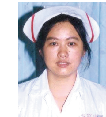
يە شىينىڭ سۇرەتى (ماتەرىيال سۇرەت). □ شىنخۇا اگەنتىنىڭ تارقاتقان

1998 - جىلى ياك يەگۇڭ ارىمىزىدىڭ تۇڭغەش رەتكى جانغا تۇرپاتتى باسقارلىھالى بومبى لۇيىن قۇرۇغا جاۋاپتى بولادى، اسكەرى قوسىن سول جىلى قۇرلىپ، سول جىلى سوعىس جۇرگىزۇ قايلەتن قايتاستىرا دى، سول جىلى 2 - زەڭبىرەكشى اسكەرلەر تارىخىنداى تۇڭغەش جانغا تۇرپاتتى باسقا ـ رلىھالى بومبىنى ئىساتى اتادى.