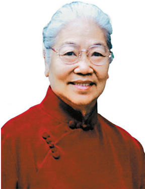
چاڭ شياڭيۇيدىڭ سۈرەتى. شېنخۇا اگەنتىتىگى تاراتقان

حىنان ولكەسى كۇڭ - ي قالاسى حلو قالاىشى نانخىدۇ قىستانىنداعى چاڭ شياڭيۇيدىڭ بايرىمى تۇرا-عنىدا، “شياڭيۇي تەتار توبى ۋومىرلى” مېگ - 15 راكتىۋ ۋشاقلىق مودەلى ەرەكشە كوز تارتادى. “بۇل ‘شياڭيۇي تەتار توبى ۋومىرلى’ ۋشاق مودەلى چاڭ شياڭيۇيدىڭ وتباسى - وتان سۇيسپەنشلىگىنىڭ ەڭ ۋاكىلىدىك سىپاتى بەينەلەنۇى سانالادى...”. ۋتۇسىندىرۇشى ەكسكۇرسىيالاشلارغا خالىق كوركەمەنەرشىسى چاڭ ش-ياڭيۇيدىڭ ۋومىرىن باياندادى.