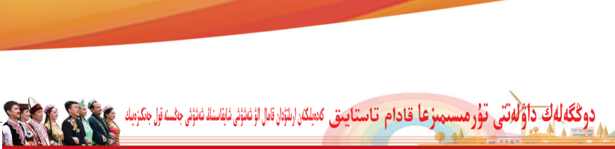
دوڭگەلەك داۋىلەتنى ئۆز مەسىلىرىغا قادم تاستاپىق كەبلىك لىپتېن قەل لى ئىمۇم ئاھلىسى قەلنى بەلە ئۇرەكەبەلە